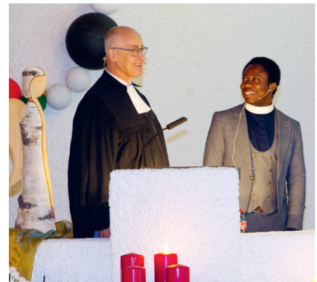
Gast aus Bossey