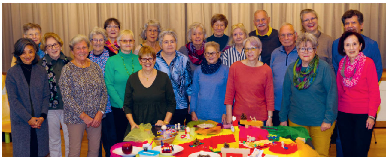
Leitende der Freiwilligengruppen