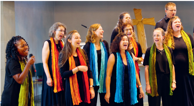
Gottesdienst mit Happy Voices