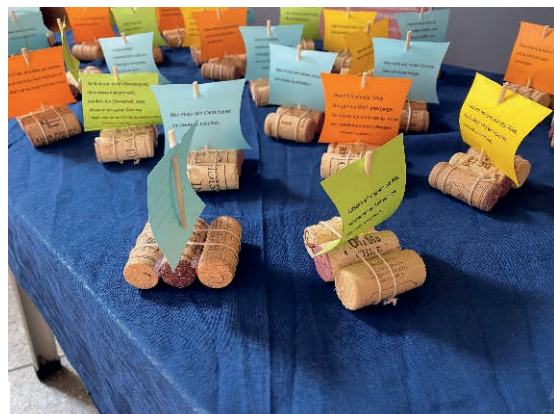
Ökumenischer Familiengottesdienst Niederwil