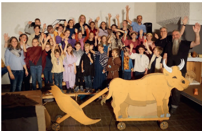
Kinder Musical Woche