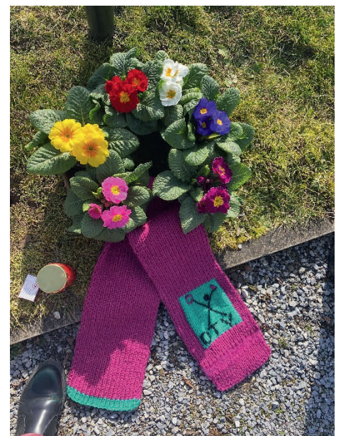
Beerdigung in Berikon