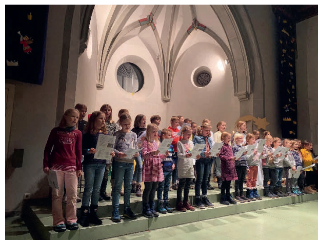
Weihnachtssingen mit Katechetinnen