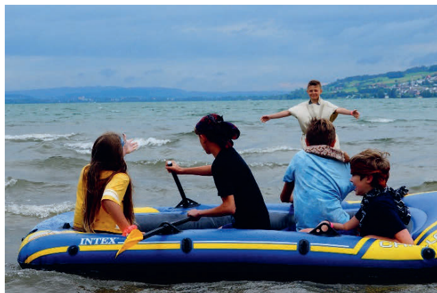
6. Klasse Wochenende