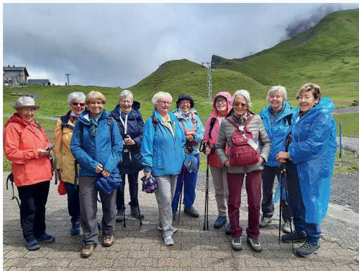
Seniorenferienwoche in Adelboden