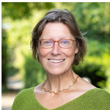
Elke Rübiger

Mit Elke Rübiger wurde unter Vorbehalt der Wahl vereinbart, dass sie die Stelle am 1. Mai 2022 antritt und damit verbunden zusammen mit ihren beiden erwachsenen Jugendlichen (1 Tochter und 1 Sohn) ins derzeit unbewohnte Pfarrhaus Widen einzieht und dieses wieder zum Leben erweckt.