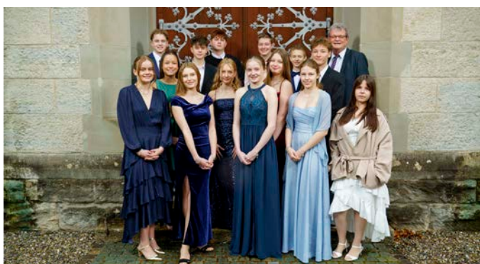
Bremgarten 29. März 2026