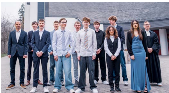
Mutschellen 22. März 2026