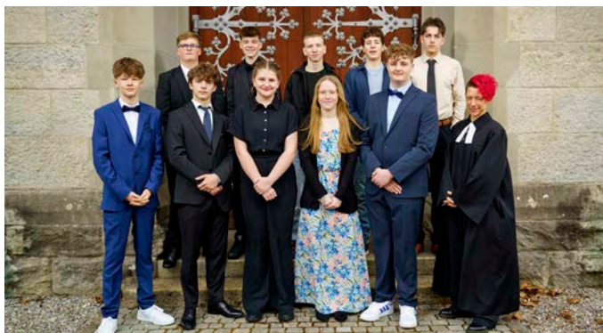
Bremgarten 22. März 2026