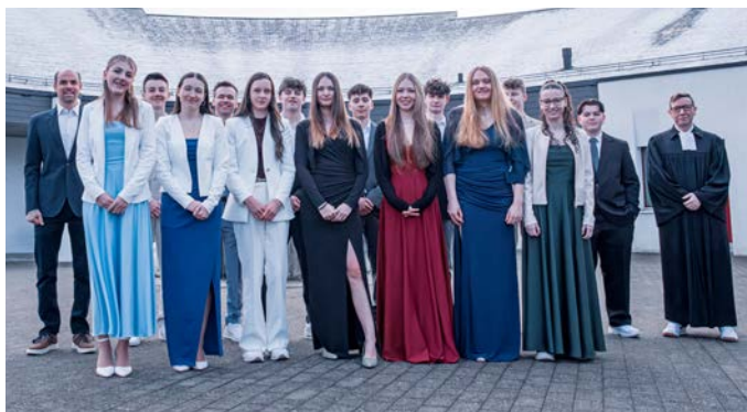
Mutschellen 15. März 2026